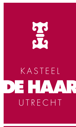
Productie: Komma Creatie | Ontwerp: Reclame collega's

Kasteel de Haar, Kasteellaan 1, 3455 RR Haarzuilens, www.kasteeldehaar.nl